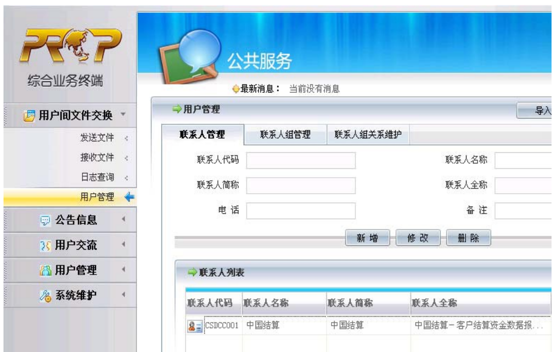
通过综合业务终端新增联系人